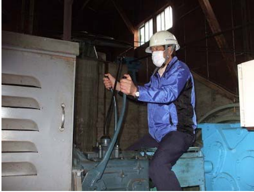
予備原動機運転訓練①