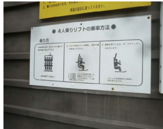
クワッドリフト乗車方法の掲示