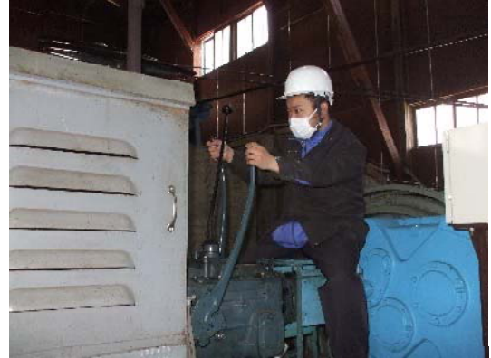
予備原動機運転訓練②