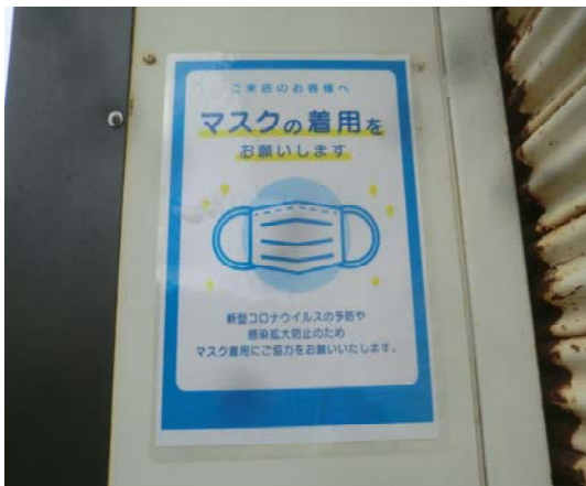
乗り場でのマスク着用の掲示